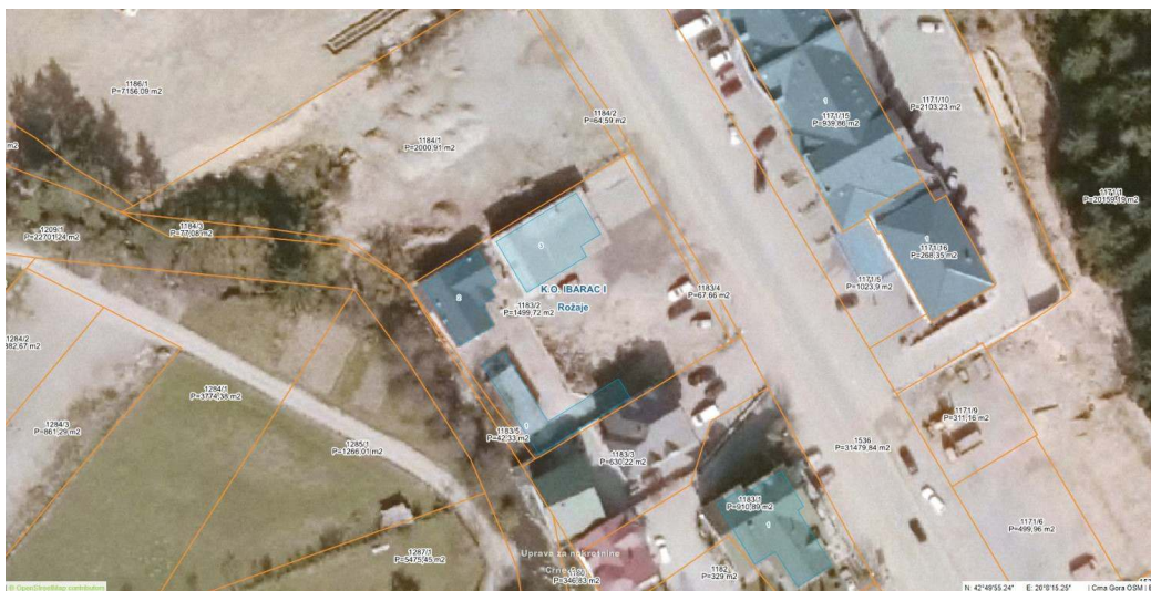
Slika 2.1: Granica parcele 1183/2