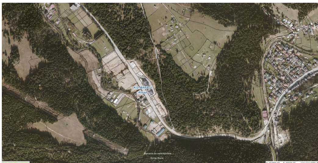
Slika 2.2: Širi prikaz lokacije objekta

Na lokaciji ima više objekata. Teren lokacije je ravna betonirane površine sa dominacijom zeljaste vegetacije po obodu parcele.